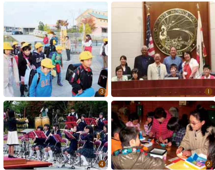
①国際感覚豊かな人材育成をめざした「中学生海外派遣事業」②放課後子どもプラン③地域全体で子どもを育てることを目的とする「ぎずな(木津南)プロジェクト」のあいさつ運動④中学生や音楽サークルが参加する「かも野外音楽フェスタ」