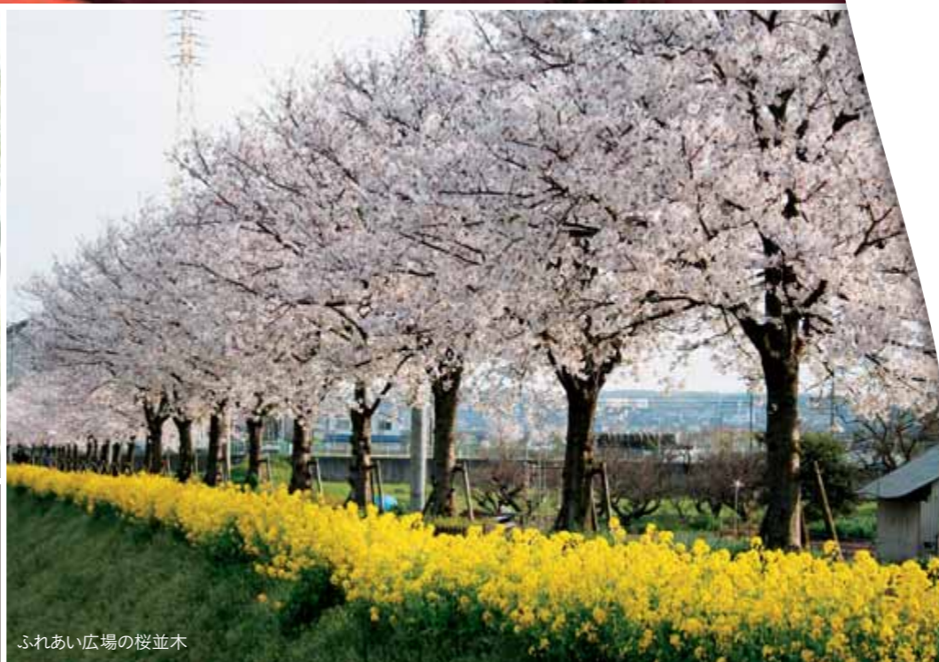
ふれあい広場の桜並木