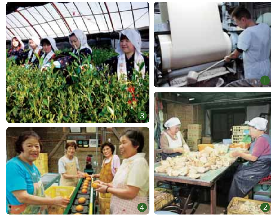
①全国シェア60%をもつ地場産業「壁紙織物業」②山城地域で有名なブランド農産物である「タケノコ」③福寿園ソーラー・グリーンハウスでおこなわれる新茶初摘み行事④鹿背山の富有柿出荷