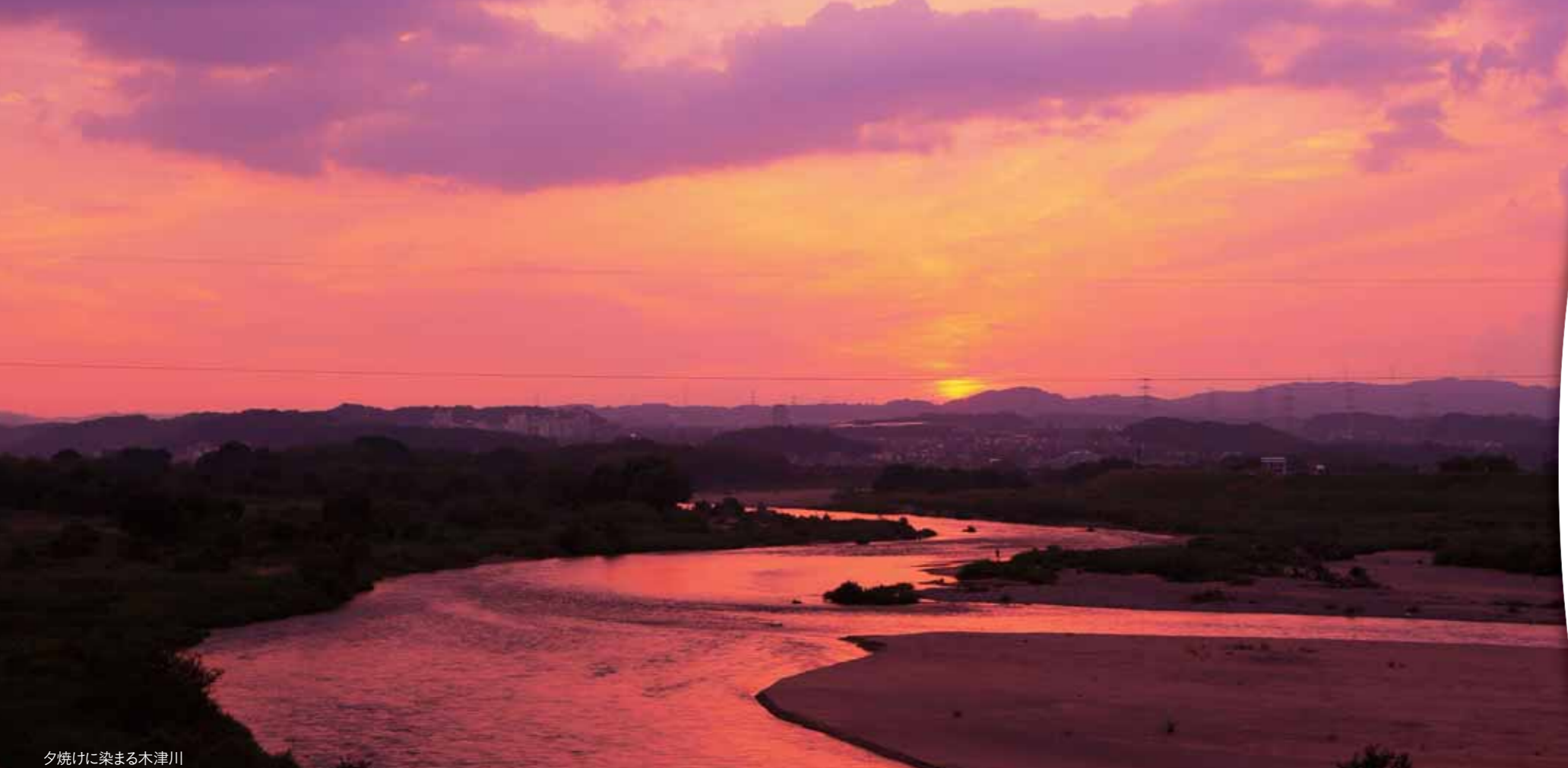
夕焼けに染まる木津川