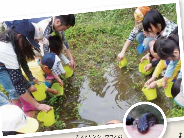
カスミサンショウウオの放流