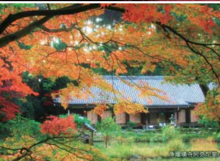
浄瑠璃寺阿彌陀堂