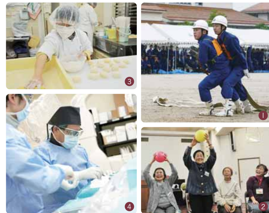
①消防技術の向上をめざす「消防団操法大会」②介護予防・健康維持をめざしたデイサービス(元気デイ)③多機能型障害福祉サービス事業所「いづみ福祉会」での就労支援活動④京都府南部の公的中核病院である「京都市山城総合医療センター」