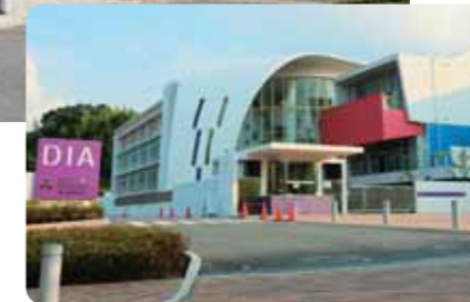
同志社国際学院初等部・国際部(DISK)