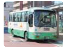
コミュニティバス