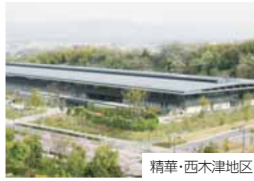
精華・西木津地区