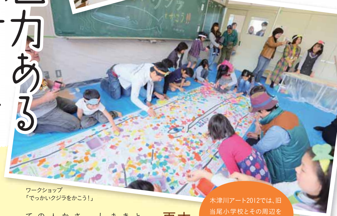
ワークショップ「でっかいウジラをかこう!」

木津川アート2012では、旧当尾小学校とその周辺を舞台に、出展作家さんを中心に展示とワークショップがおこなわれました。