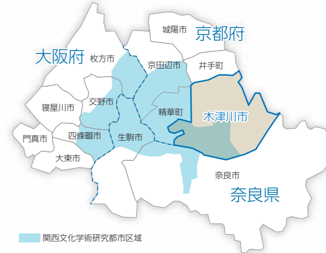
関西文化学術研究都市区域

先端的レーザーを開発し、物理・科学研究、産業、医療などへの応用をめざした研究をおこなう機関です。