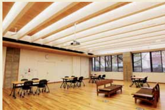
市役所内部(住民活動スペース)

市民の声を反映し、 よりよい まちをめざします まちの将来像『水・緑・歴史が 薫る文化創造都市くひとが輝き ともに創る豊かな未来』を 実現するため、市民の代表である市 長と議員が互いに独立した立場か ら協力し合い、健全な市政運営に 努めています。 木津川市議会では、市民の代表 として選挙によって選ばれた議員 が、市民の願いを市政に反映させ るため、条例の制定や予算などの 決定、決算の認定、選任同意、 請願審議などをおこなっています。