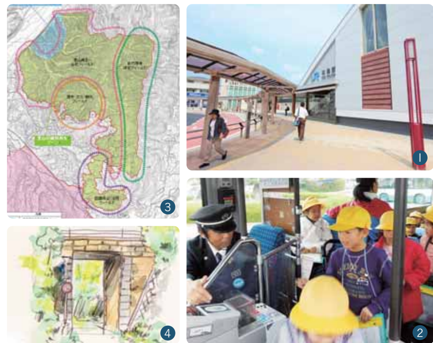
①片町線・奈良線・関西本線が乗り入れる「JR木津駅」②木津・加茂・山城地域で運行している「コミュニティバス」③土地利用計画が策定された「学研木津北地区」④大仏鉄道の遺構の中で、最も代表的な「赤橋」