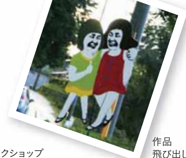
作品飛び出し坊やたち