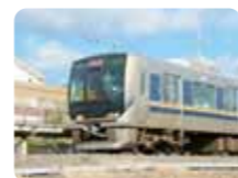
JR片町線(学研都市線)