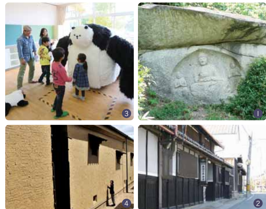
①美しい日本の歴史的風土100選にも選ばれた当尾の石仏(わらい仏)②茶問屋が軒を連ねる上粕地区の山城茶問屋街③旧当尾小学校とその周辺を舞台にした「木津川アート」④木津川アートや市民イベントなどで再活用されている、旧家「八木邸」