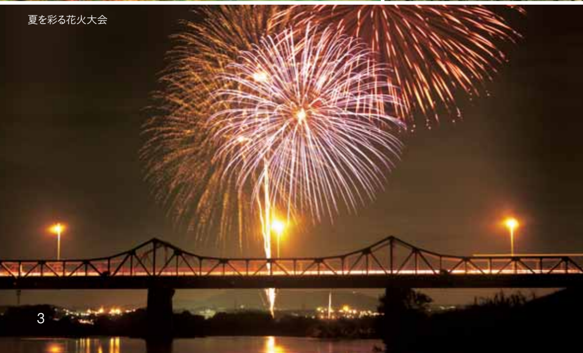
夏を彩る花火大会