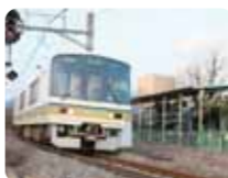
JR関西本線(大和路線)