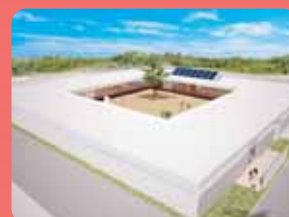
平成26年春に保育園が開園予定