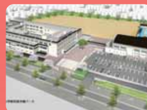
平成26年春にエコスクール型小学校が開校予定

平成24年5月1日、「農(みのり)のまちづくり」をテーマとする学研木津中央地区「城山台」がまちびらきました。今後、新たに小学校や公園なども整備されることから、城山台から木津川市全体のさらなる発展に向けての飛躍が期待されます。