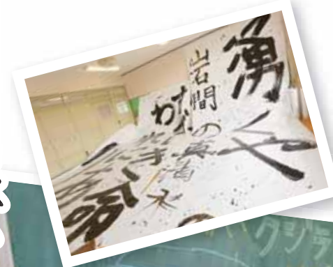
ワークショップ「旧当尾小学校の校歌を書きま書」