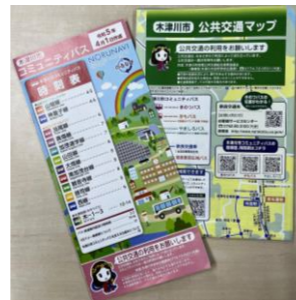
時刻表・公共交通マップ