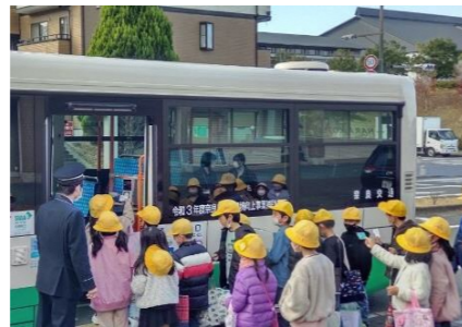
バスの乗り方教室