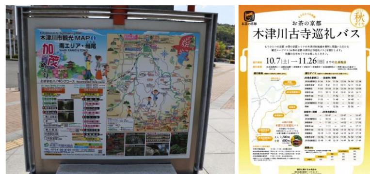
バスの運行情報が掲載された観光マップ