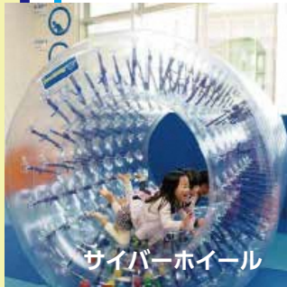
サイバーホイール