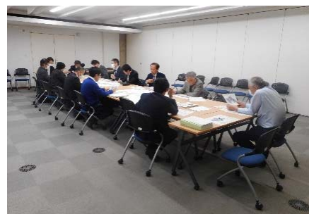
(当日の会議の様子)

なお、本イメージ図(案)は事業区域や用途の面積などを確定したものではないことを地権者の皆さんに理解していただく必要があります。