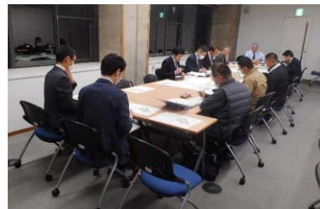
（当日の会議の様子）

この資料を基にして、令和2年度に、コンパクトな区域設定や区域分割、大街区化等に向けた具体的な検討を進めていきます。