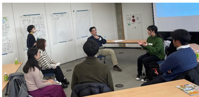
市長の問いかけに応える参加者（左：高校生／右：大学生・社会人）