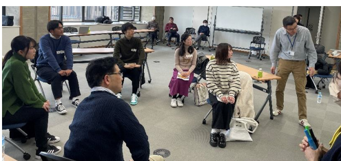
グラフィックレコードで意見を確認する参加者（左：高校生／右：大学生・社会人）