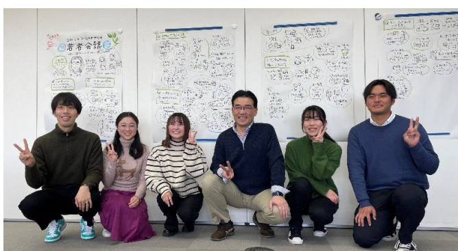
最後に市長と参加者で記念撮影（左：高校生／右：大学生・社会人）